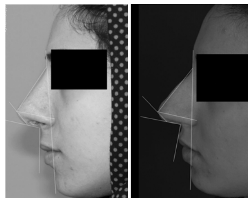
شکل‌های- ۳ و ۴: تصویر زوایا صورت بیمار در گروه Lateral crural overlay قبل (راست) و پس از عمل (چپ).

افتادن نوک بینی است. هنگامی که این اتفاق می‌افتد، نوک بینی آویزان می‌شود (Saging) و به شکل گرد و نوسان‌کننده‌ای در می‌آید که خصوصاً در نیم‌رخ مشخص است. ۱۱ تاکنون جراحان بسیاری انواع مختلفی از بخیه جهت اصلاح نوک بینی را در روش جراحی باز توضیح داده‌اند. سوچور Septocolumellar یکی روش‌هایی است که می‌توان آن را به عنوان بخیه حلقه‌ای بین سپتوم و کروورای داخلی توضیح داد. ۴ Tezel نیز در یک مطالعه پس از بررسی ۴۳۳ رینوپلاستی اولیه و ۶۲ مورد رینوپلاستی ثانویه نشان داد که در روش سوچور Septocolumellar، بسته به سطح ورود (Penetration) بخیه، پروجکشن نوک بینی می‌تواند افزایش یا کاهش یابد، نوک بینی می‌تواند دچار چرخش شود و Columellar show می‌تواند تصحیح گردد. ۴ این بخیه همچنین باعث می‌شود کروورای داخلی و سپتوم به سختی به یکدیگر ثابت شوند، در نتیجه باعث استحکام بیشتر شوند. آنها در نهایت ادعا کرده‌اند که این تکنیک، به عنوان یک جایگزین