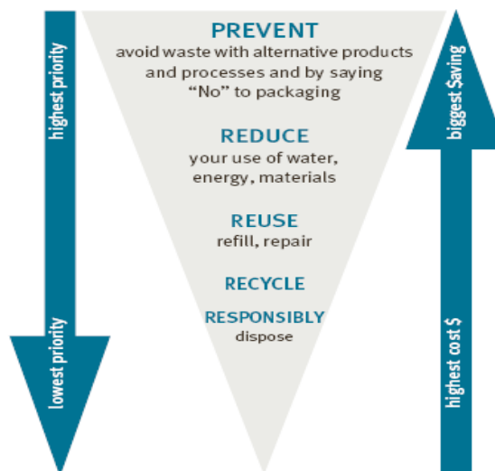
شکل ۱- هرم کمینه سازی ضایعات

بر این اساس برای شروع تحقیق، ابتدا از طریق مطالعات کتابخانه ای و جستجوهای اینترنتی همچنین با مراجعه به مراکز و سازمان های ذیربط، اطلاعات لازم در زمینه سیستم مدیریتی کمینه سازی ضایعات و صنعت رنگ سازی جمع آوری گردیده و با مطالعه و بررسی آن ها نسبت به موضوع